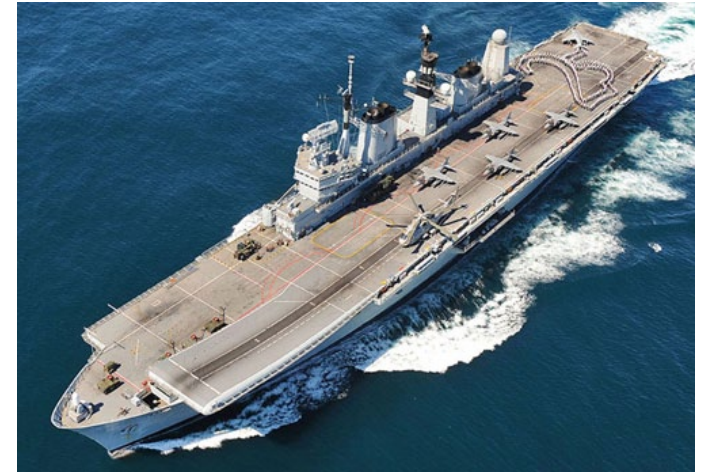
Авианосец «Арк Ройял»

А вот в Великобритании очень оригинально подходят