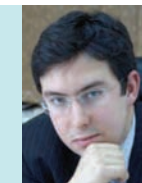
Антон Бучнев Директор Департамента Инвестиционных Проектов Правительство Санкт-Петербурга